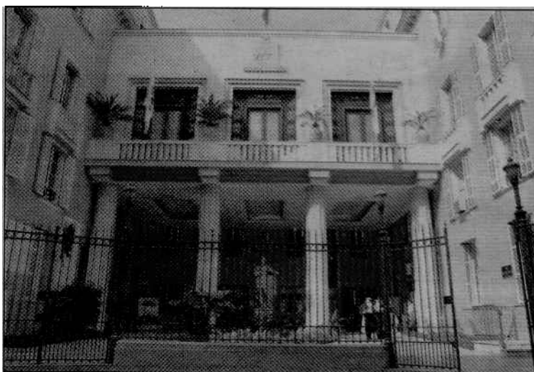
Avoir son buste sculpté par Cyril de la Patellière et posé dans la mairie de Nice : le rêve de nombreuses jeunes filles... (Photo Cyril Doderigny)

bre. Un dispositif a été mis en place afin qu'un seul vote par adresse mail soit possible.